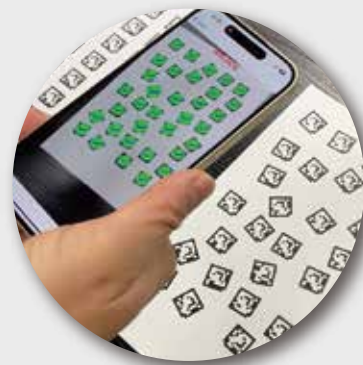
不揃いのAsCodeも正確に読取