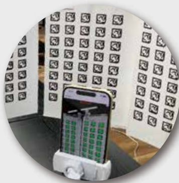
超高速で正面・斜めからも読取