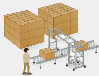
RFIDアンテナと、電波が遮断されるイメージ図